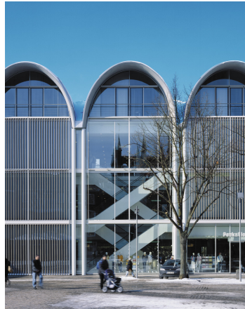
TONALITY® Sonnen- und Sichtschutz