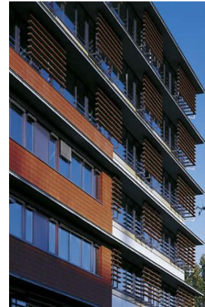
TONALITY® Sonnen- und Sichtschutz