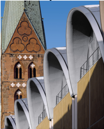
TONALITY® Sonnen- und Sichtschutz